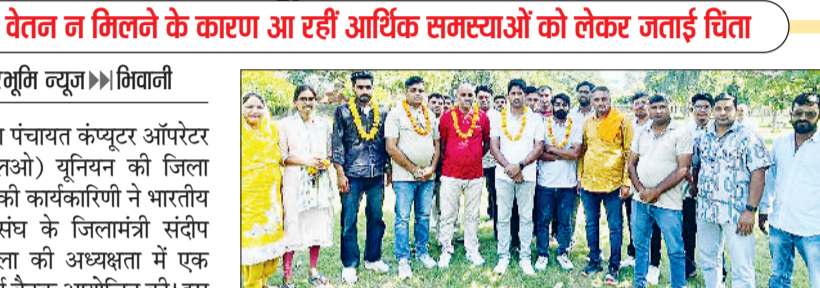
भिवानी। वेतन की मांग को लेकर प्रदर्शन करते कंप्यूटर ऑपरेटर।