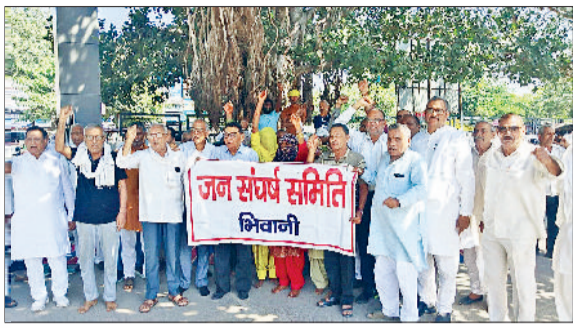
भिवानी। नागरिक अस्पताल की विभिन्न समस्याओं के खिलाफ विरोध जताते जनसंघर्ष समिति के सदस्य।

77 लाख रुपये ग्रांट आने के बावजूद नागरिक अस्पताल में नहीं लगी लिफ्ट