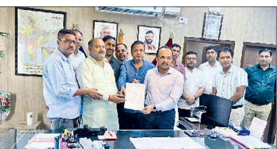
भिवानी। हरियाणा विद्यालय शिक्षा बोर्ड के चेयरमैन को मांगपत्र सौंपते हुए।

प्राइवेट स्कूल वेलफेयर एसोसिएशन का प्रतिनिधि मंडल शिक्षा बोर्ड के चेयरमैन से मिला। प्रतिनिधि मंडल ने बताया कि हरियाणा विद्यालय शिक्षा बोर्ड द्वारा एफिलिएशन लेते समय प्राइवेट स्कूलों पर 18 प्रतिशत का जीएसटी लगाया गया है, जो पिछले 5 साल से बकाया पोर्टल पर दिखाया गया है। एसोसिएशन ने इसका विरोध जताया और कहा कि शिक्षा का व्यवसायीकरण किया जा रहा है।