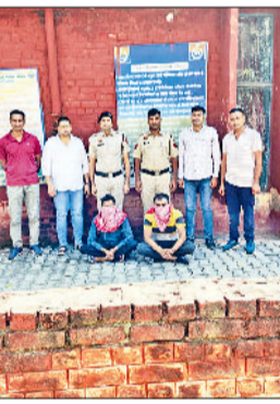
पुलिस हिरासत में आरोपी।

एक महीने के लिए योजना 40 किलो दूध, 10 किलो दही और 5 किलो पनीर चाहिए।