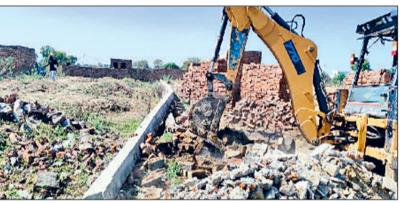
बवानीखेड़ा। अवैध निर्माण हटाती जंसीबी।

नगर योजनाकार विभाग द्वारा उपायुक्त साहिल गुप्ता के निर्देशानुसार अवैध निर्माण हटाने का अभियान चलाया गया। इस दौरान विभाग ने मौजा बवानीखेड़ा में भिवानी-जमालपुर रोड पर लागूमान तीन एकड़ में फैली दो कॉलोनी से अवैध निर्माण को हटाया। नगर योजनाकार विभाग के अनुसार मौजा बवानीखेड़ा में भिवानी-जमालपुर रोड पर तीन एकड़ में बनी अवैध कॉलोनी से अवैध निर्माण हटाने का अभियान चलाया गया। इस दौरान कानून व्यवस्था बनाए रखने के लिए डीसी द्वारा नियुक्त ड्यूटी मैजिस्ट्रेट नवीन कुमार व पुलिस बल मौजूद रहा।