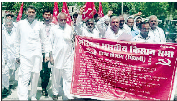
तोशाम। मांगों को लेकर प्रदर्शन करते किसान।