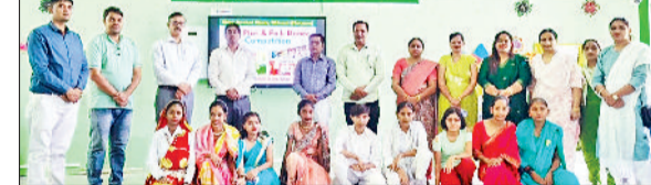
बवाणी खेड़ा। बवाणी खेड़ा के वीर शहीद कपिल देव जी राजकीय मॉडल संस्कृति वरिष्ठ माध्यमिक विद्यालय में खंड स्तरीय रोल-प्ले एवं लोक-नृत्य प्रतियोगिताओं का आयोजन में उपस्थितजन।

बवाणी खेड़ा के वीर शहीद कपिल देव जी राजकीय मॉडल संस्कृति वरिष्ठ माध्यमिक विद्यालय में खंड स्तरीय रोल-प्ले एवं लोक-नृत्य प्रतियोगिताओं का आयोजन किया गया। प्रतियोगिता में खंड के विभिन्न विद्यालयों की टीमों ने बढ़-चढ़कर भाग लिया और अपनी प्रतिभा का शानदार प्रदर्शन किया। विद्यार्थियों ने अपने रोल-प्ले के माध्यम से कुरकुरे न खाने, रैप आदि आज के समय के गानों पर कटाक्ष, दहेज आदि सामाजिक एवं शैक्षणिक विषयों पर उकृष्ट प्रस्तुति दी तथा लोक-नृत्य के माध्यम से हरियाणा की लोक संस्कृति की सुंदर झलक प्रस्तुत की।